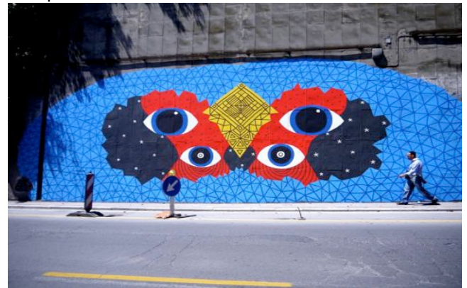
Fresque DEM, Ericailcane,...